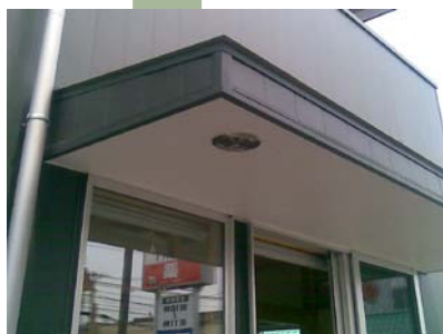
ガルバニウム底 塗替え